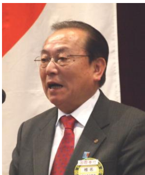
椎名正良次期ガバナー補佐