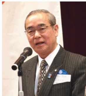
関口 徳雄ガバナーエレクト