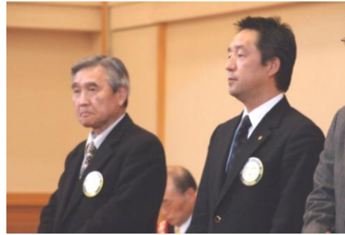
次年度会長・幹事紹介