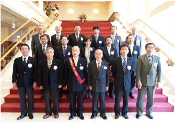
ガバナー補佐・ガバナーエレクトを囲んで