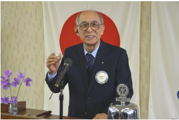
新年の乾杯、音頭は加瀬会員