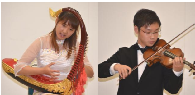
留学生たちも熱演