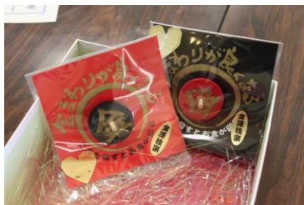
プレゼントの「お金が回る独楽」

そのような中にも「このままではいけない。もっと自分自身を変えなければ…」と悩みながらもお客様を訪問し続けていると、ある答えにたどりつきました。