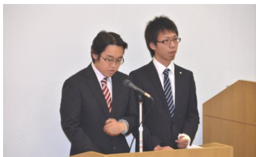
司会はRACのメンバー