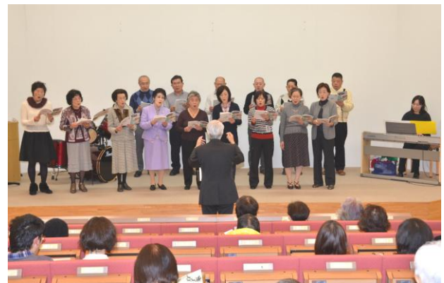
コーロハモンティアーノの演奏

またこのあいだ受章した文化勲章を胸に出席しています。世界的なノーベル賞ではありますが、