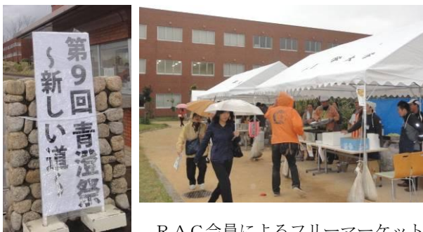
RAC会員によるフリーマーケット